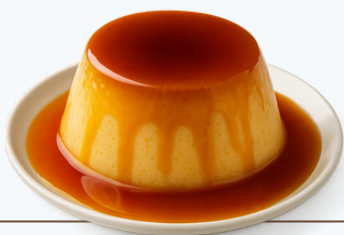
Pudim de leite condensado 60g (149kcal)