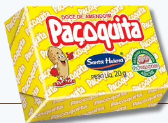
1 unidade de Paçoquinha 20g (103kcal)