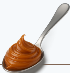
1 colher de doce de leite 20g (64kcal)