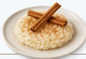
Arroz doce com açúcar e canela 100g (5 colheres de sopa rasa) (136kcal)