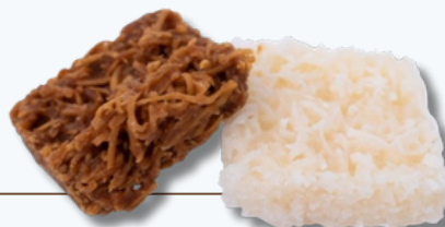
1 unidade de cocada 30g (100kcal)