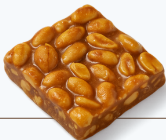
1 unidade de pé de moleque 30g (150kcal)